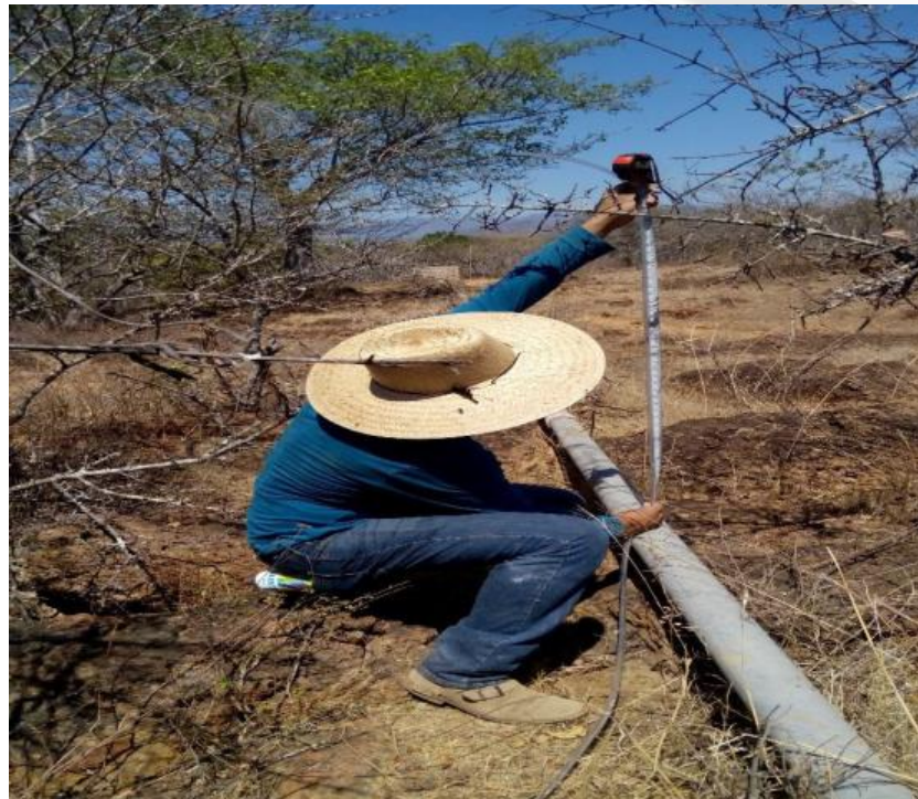
VERIFICACION DE NIVELES (LINEA EXISTENTE)

REHABILITACION DEL SISTEMA DE AGUA POTABLE, MEDIANTE LA COLOCACION DE VALVULAS EXPLILOSAS