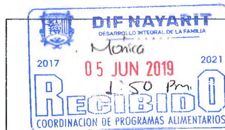
SELLO DIF MUNICIPAL