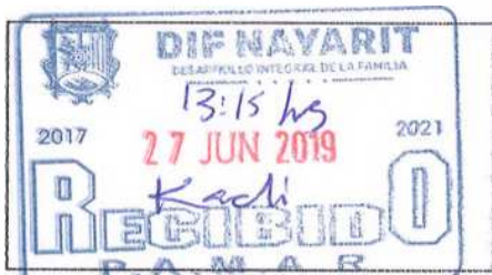
SELLO Y FIRMA DE RECEPCION