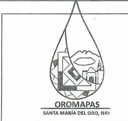
SELLO DE O. R. O. M. A. P. A. S.