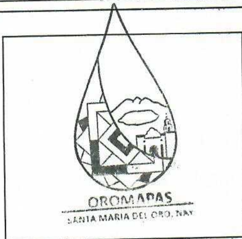
SELLO DE O. R. O. M. A. P. A. S.