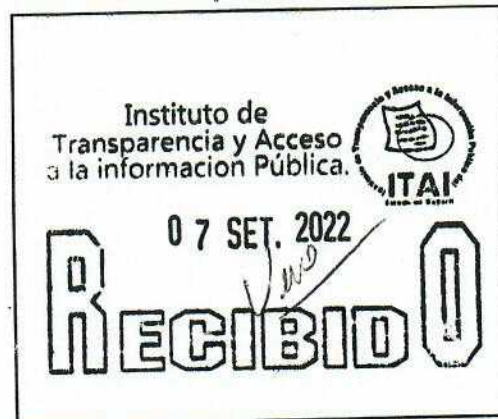
SELLO DE RECEPCIÓN