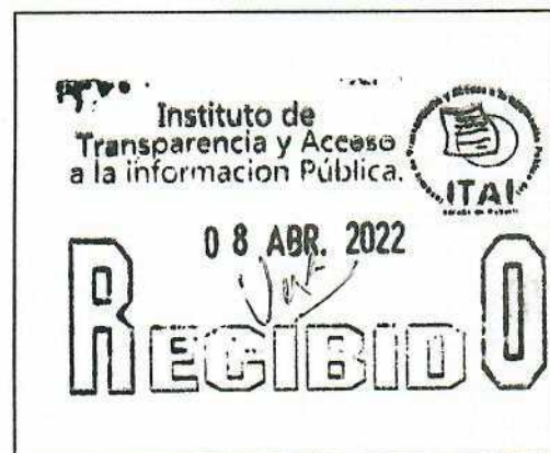
SELLO DE RECEPCIÓN