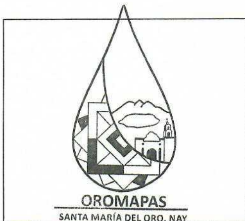
SELLO DE O. R. O. M. A. P. A. S.