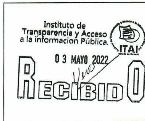
SELLO DE RECEPCIÓN