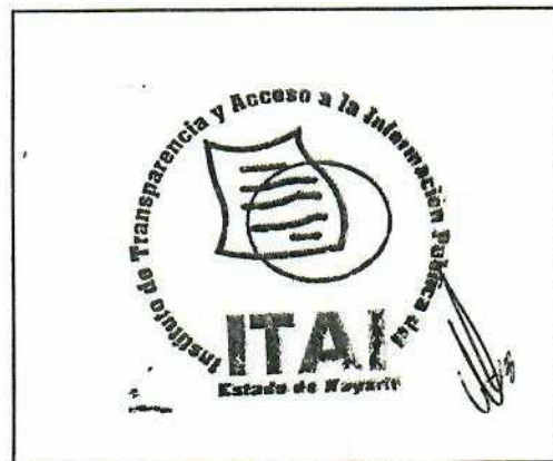
SELLO DE RECEPCIÓN