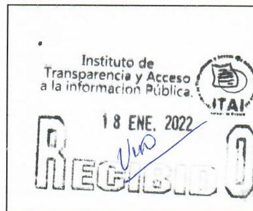
SELLO DE RECEPCIÓN