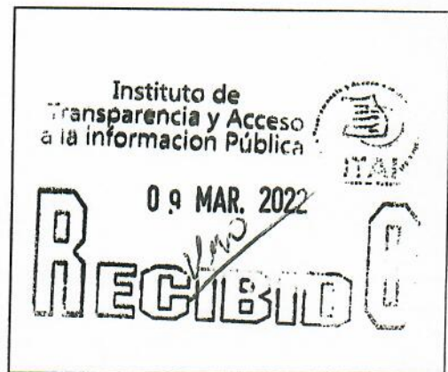
SELLO DE RECEPCIÓN