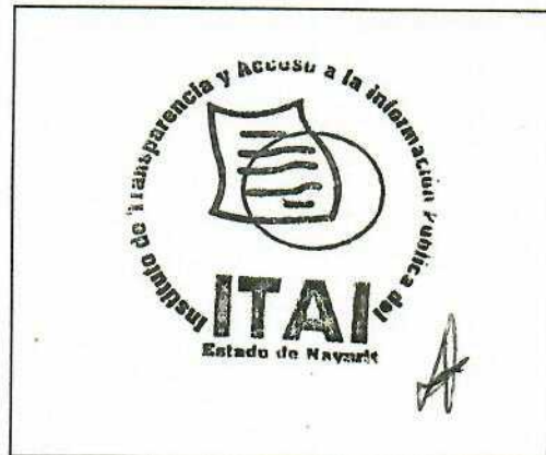
SELLO DE RECEPCIÓN