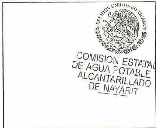
SELLO DE RECEPCIÓN