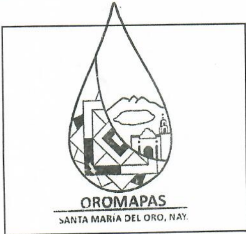
SELLO DE O. R. O. M. A. P. A. S.