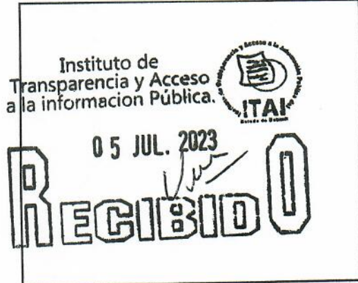
SELLO DE RECEPCIÓN