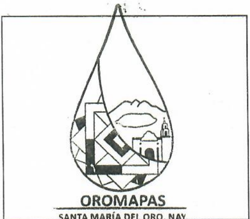
SELLO DE O. R. O. M. A. P. A. S.