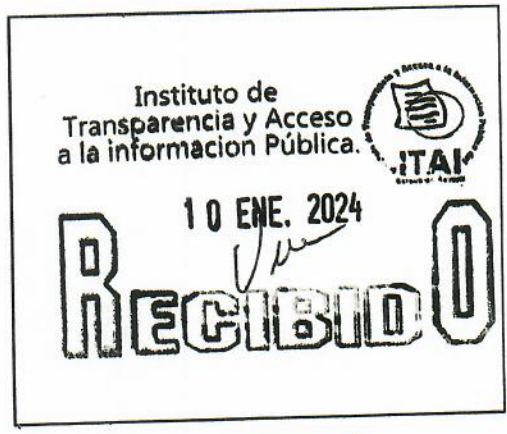
SELLO DE RECEPCIÓN