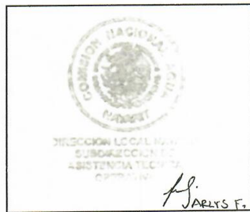
SELLO DE RECEPCIÓN