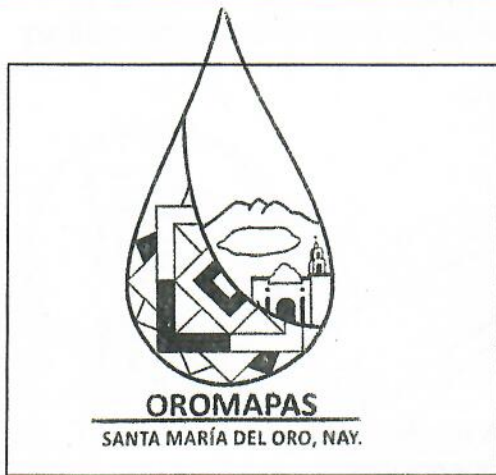
SELLO DE O. R. O. M. A. P. A. S.