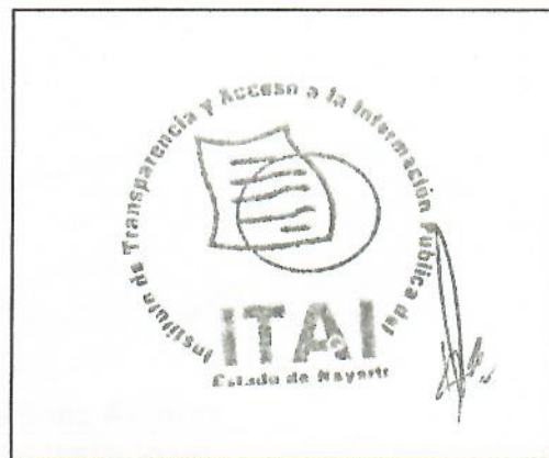
SELLO DE RECEPCIÓN